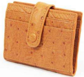
حافضة بطاقات مع قفل