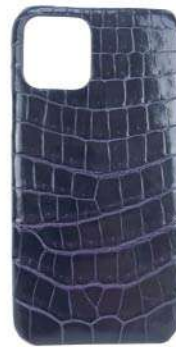
آيفون 11 برو