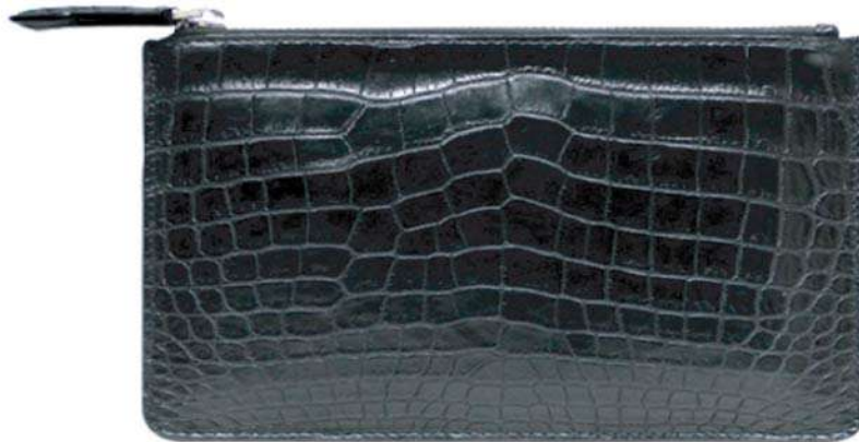
محفظة بسحاب علوي