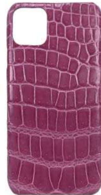
آيفون 11 برو ماكس