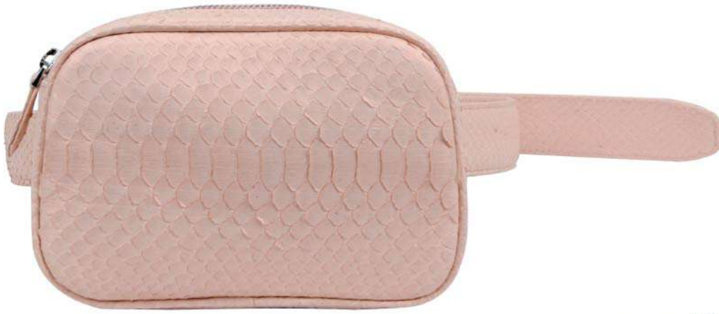
حقيبة خصر بايتون