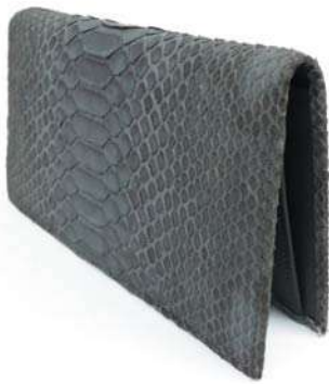
2 بولار مع بطاقات