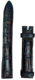
حزام ساعة التمساح