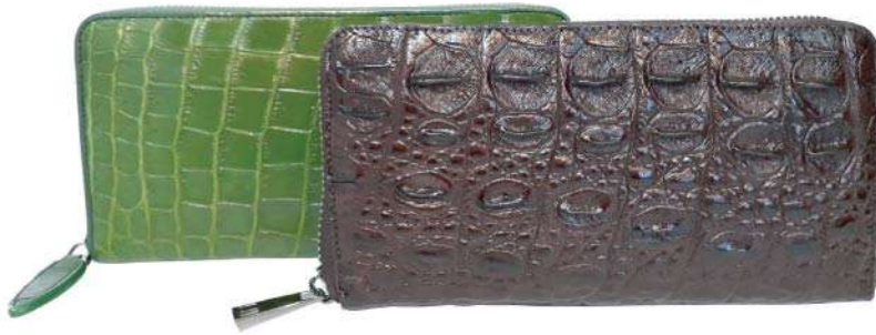
محفظة بسحاب دائري